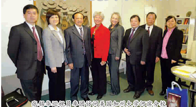
张锡华巡视员率团访问美国加州大学河滨分校

11月15日—21日,副校级巡视员张锡华率浙江工商大学代表团一行6人,应邀访问加拿大多伦多国际学院、美国加州大学河滨分校。