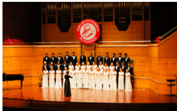
合唱《她像那燕子》《大江东去》声乐甲组一等奖 指导老师：邹丽霞