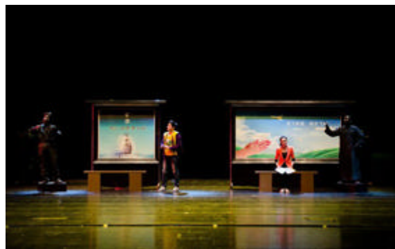
小品《车站》戏剧甲组一等奖、优秀创作奖 指导老师：沈晓婧

展演开幕式上，我校大学生艺术团受邀担任重要演出，充分地展示了浙江大学生的时代风采，为学校 and 浙江赢得了声誉。期间，我校大学生艺术团来到富阳市龙门古镇，和佳木斯大学、伊犁师范学院的大学生顶着寒风为到场观众