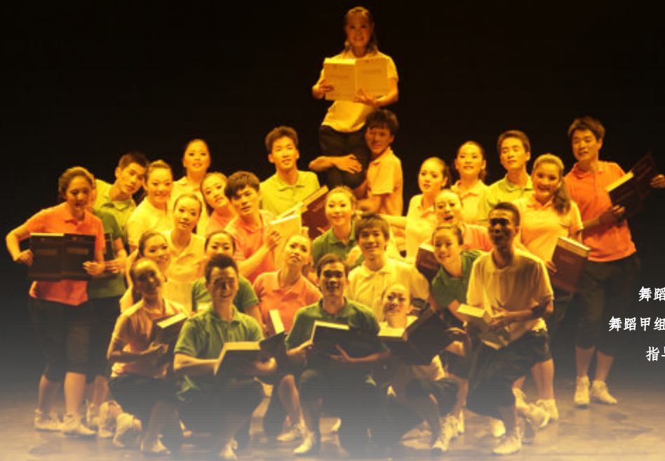
舞蹈《书伴我同行》 舞蹈甲组一等奖、优秀创作奖 指导老师：屠锋锋