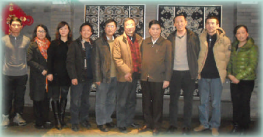
学校原副校长张建平和校友办一行看望 原贵州省政协副主席王录生等校友